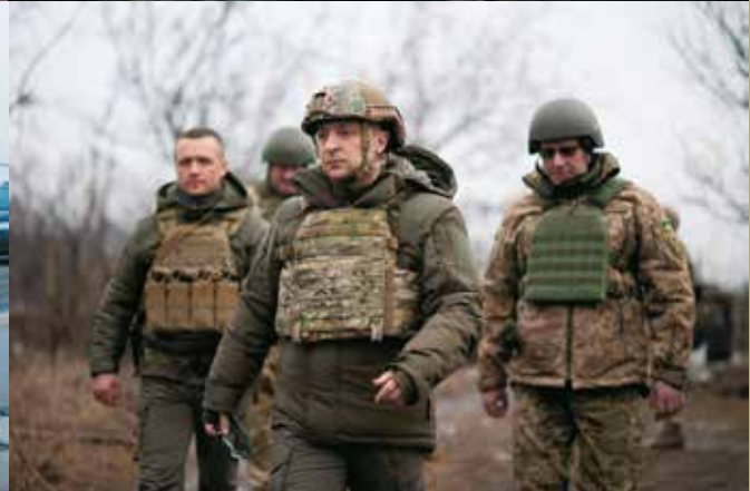
Президент України Володимир ЗЕЛЕНСЬКИЙ разом з послами західних країн у зоні проведення ООС