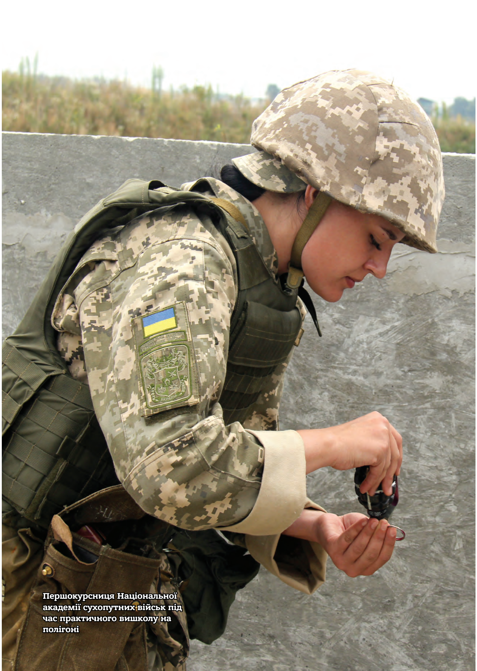
Першокурсниця Національної академії сухопутних військ під час практичного вишколу на полігоні