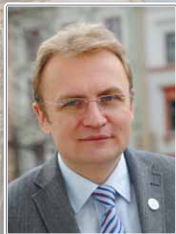
Міський голова Львова Андрій САДОВИЙ

Слава Академії Сухопутних військ! Слава українському вояцтву! Слава Україні!