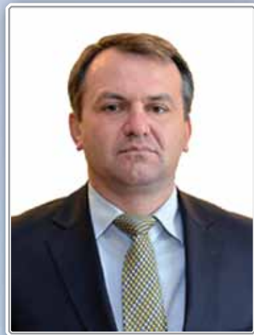
Голова Львівської обласної державної адміністрації Олег СИНЮТКА

За вашою спиною – мудрість викладачів, які передали вам знання і навички українського війська – досвід наших воїнів, які в ці дні невтомно захищають наш спокій. Нехай їхня сила та мужність надихають кожного з вас щодня. Адже відсьогодні ви не просто офіцери, ви – майбутні командири спільної української перемоги.