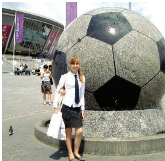
2013 рік. Донецьк. Донбас Арена. Нагородження переможців обласних олімпіад.