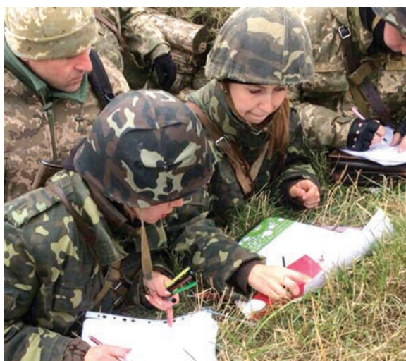
2014 р. Львів. Міжнародний центр миротворчості та безпеки. Курс заняття з управління діями механізованих підрозділів.