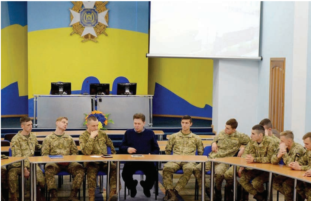
Під час «круглого столу» з курсантами

Життя сучасної людини складно уявити без соціальних мереж, проте вони не є панацеєю. Ба більше – соцмережі виступають в якості носіїв меседжів, безпосередньо пов'язаних з гібридною агресією. Найбільш ефективною зброєю гібридної агресії нині виглядають фейки – неправдиві повідомлення, які розраховані на емоційне сприйняття, вони грають на людських слабкостях. Маємо зауважити, що фейки – не лише елемент сучасного інформаційного життя, але й дуже поширений формат повідомлень, в яких використовується напівправа або постправа.