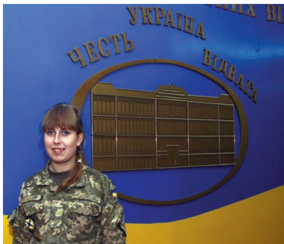
2015 р. Львів. Національна академія сухопутних військ. Урочисте зібрання до 24-ї річниці Збройних Сил України