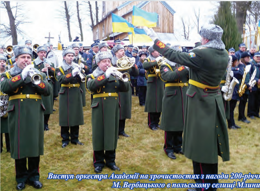
Виступ оркестра Академії на урочистостях з нагоди 200-річчя М. Вербицького в польському селищі Млини.

Вербицького в її стінах. Того ж року композитор спробував отримати посаду диригента у Ставропільському інституті, але з невідомих причин отримав відмову. Це підштовхнуло його до серйозного вивчення музичної теорії, гармонії, композиції та інструментування. Деякий час він утримував родину уроками співу та гри на гітарі у вірменському монастирі бенедиктинок, а також працював диригентом монастирського хору і платним тенором латинського кафедрального собору у Львові. Коли ж його дружина Барбара померла, Вербицький, за рекомендацією єпископа Снігурського, був прийнятий на посаду вчителя співу в семінарії, а 1841 року поновив навчання на III курсі богослов'я.